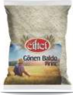
Gönen Baldo Pirinç Gonen Rice