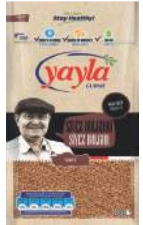
Siyez Bulgur Siyez Bulgur