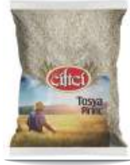
Tosya Pirinç Tosya Rice