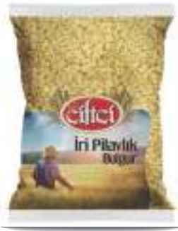
İri Pilavlık Bulgur Bulgur Large Coarse Grade