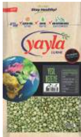
Yeşil Bezelye Green Peas