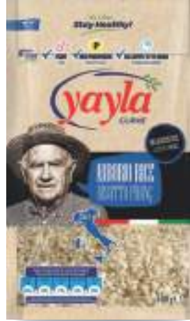
Risotto Pirinç Arborio Rice