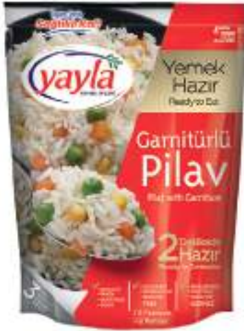
Garnitürlü Pirinç Pilavı Pilaff with Garniture