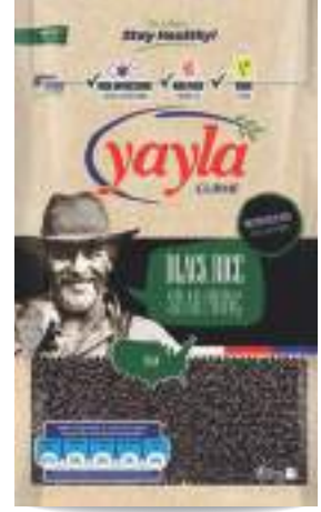
Siyah Pirinç Black Rice