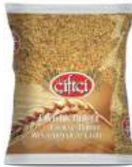
Pilavlık Bulgur Coarse Bulgur