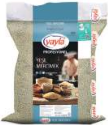
Yeşil Mercimek Green Lentils