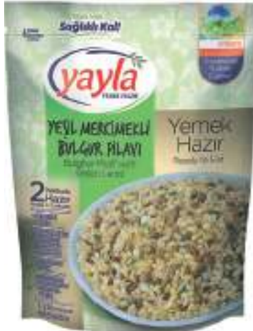
Yeşil Mercimekli Bulgur Pilavi Bulghur Pilaff with Green Lentil