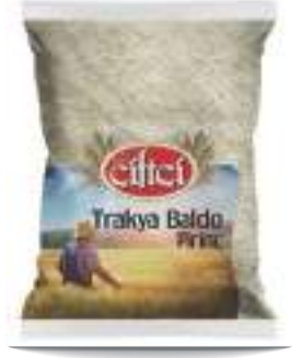
Trakya Baldo Pirinç Trakya Rice