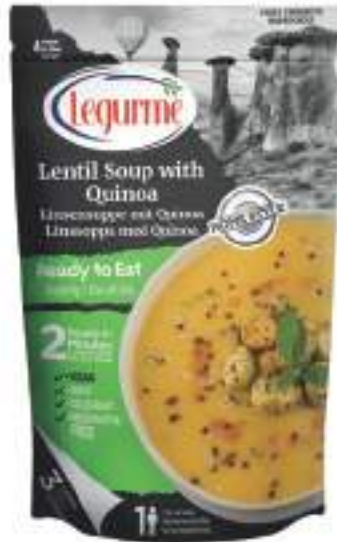
Kinoaalı Mercimek Çorbası Quinoa & Lentil Soup