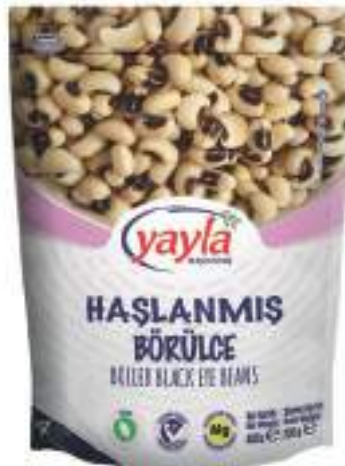
Haşlanmış Börülce Boiled Black Eye Beans