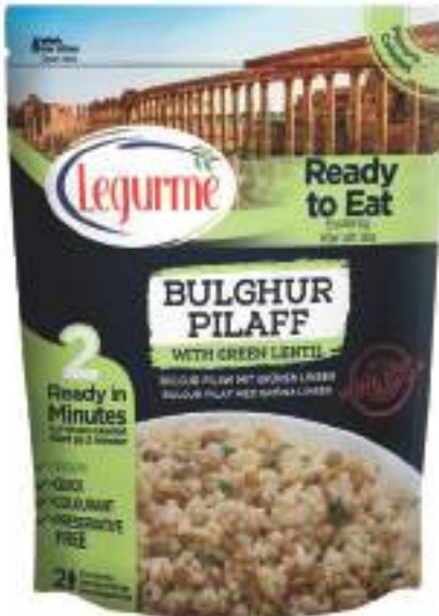
Yeşil Mercimekli Bulgur Pilavı Bulghur Pilaff with Green Lentil