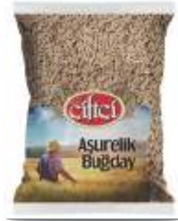
Aşurelik Buğday Peeled Wheat