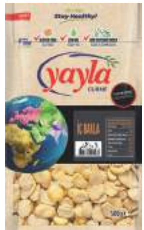
İç Bakla Fava Beans