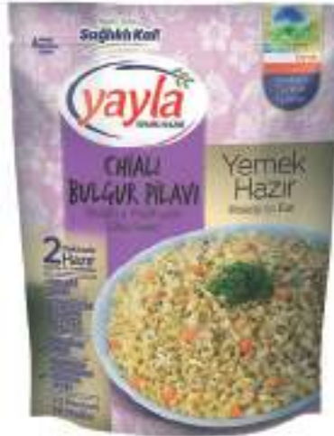
Chialı Bulgur Pilavi Bulghur Pilaff with Chia Seed