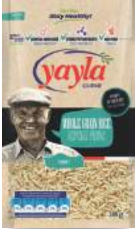
Kepekli Pirinç Whole-Grain Rice