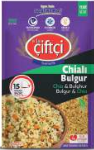
Chialı Bulgur Chia Seed & Bulgur