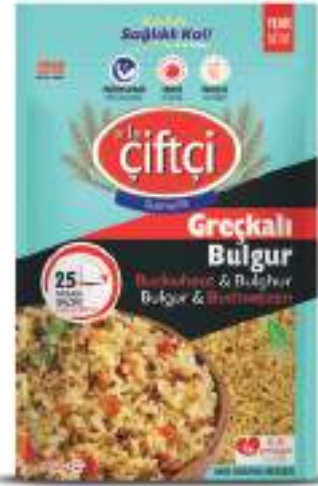
Greçkالی Bulgur Buckwheat & Bulgur