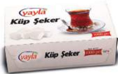
Küp Şeker Sugar Cube