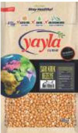
Sarı Kırık Bezelye Yellow Split Peas