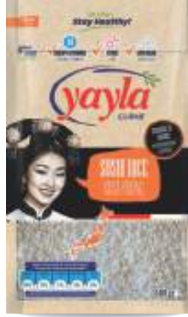
Suşi Pirinç Sushi Rice