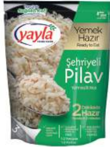
Şehriyeli Pirinç Pilavı Vermicelli Rice