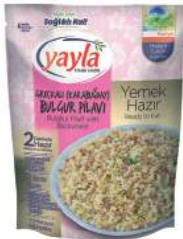
Greçkalı (Karabuğday) Bulgur Pilavi Bulghur Pilaff with Buckwheat