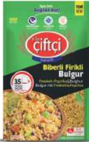
Biberli Firikli Bulgur Freekeh-Paprika & Bulgur