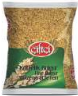
Köftelik Bulgur Fine Bulgur