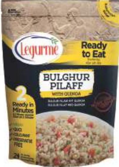
Kinoalı Bulgur Pilavı Bulghur Pilaff with Quinoa