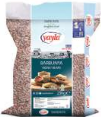
Barbunya Kidney Beans