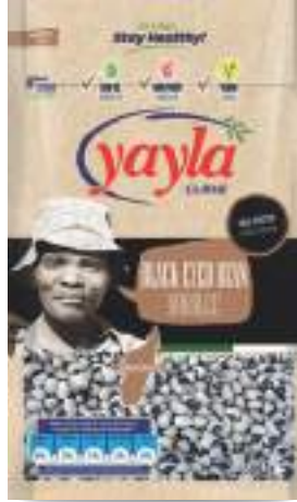
Börülce Black-Eyed Bean