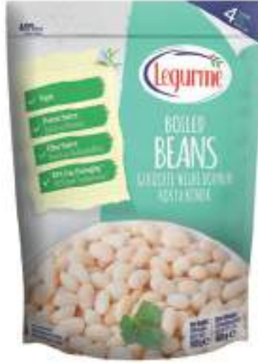
Haşlanmış Fasulye Boiled Beans