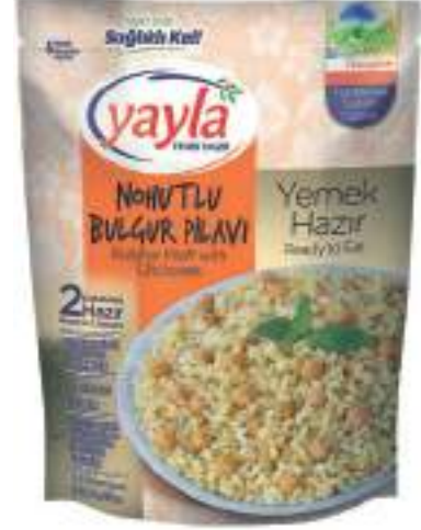
Nohutlu Bulgur Pilavi Bulghur Pilaff with Chickpeas