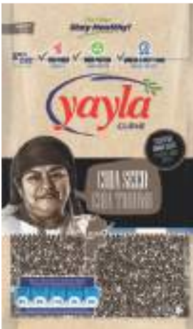
Chia Tohumu Chia Seed