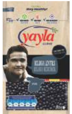
Beluga Mercimek Beluga Lentils