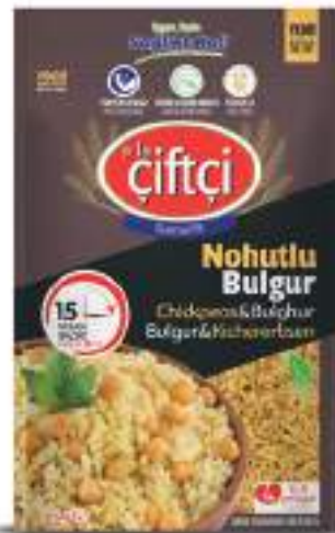
Nohutlu Bulgur Chickpeas & Bulgur