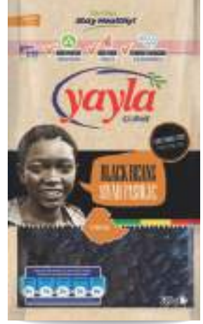
Siyah Fasulye Black Beans