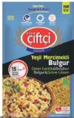
Yeşil Mercimekli Bulgur Green Lentils & Bulgur