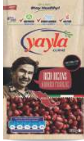
Kırmızı Fasulye Red Beans