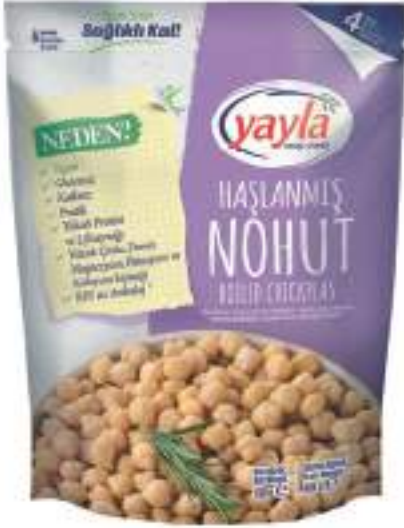
Haşlanmış Nohut Boiled Chickpeas