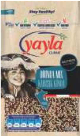
Karışık Kinoa Quinoa Mix