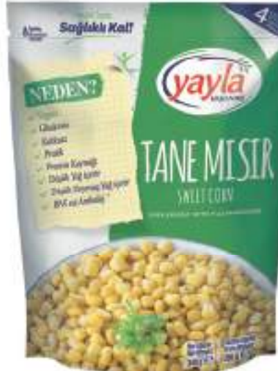
Tane Mısır Sweet Corn