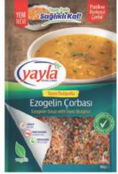
Siyez Bulgurlu Ezogelin Çorbası Ezogelin Soup with Siyez Bulgur