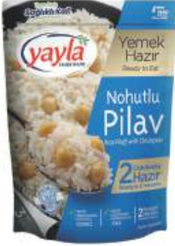
Nohutlu Pirinç Pilavı Rice Pilaff with Chickpeas