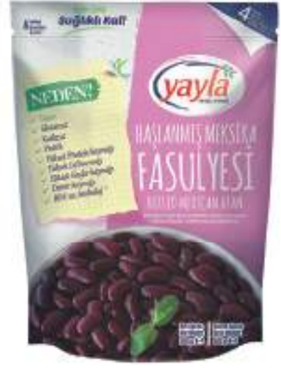
Haşlanmış Meksika Fasulyesi Boiled Mexican Bean