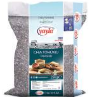
Chia Tohumu Chia Seed