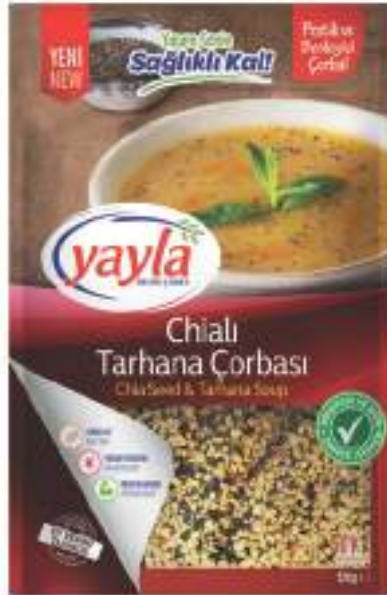
Chialı Tarhana Çorbası Chia Seed & Tarhana Soup