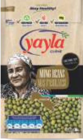
Maş Fasulyesi Mung Beans