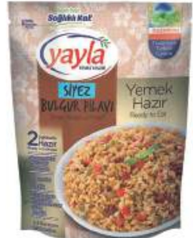
Siyez Bulgur Pilavi Siyez Bulgur Pilaff