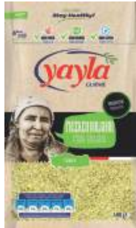
Firik Bulgur Freekeh Bulgur