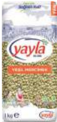
Yeşil Mercimek Green Lentil