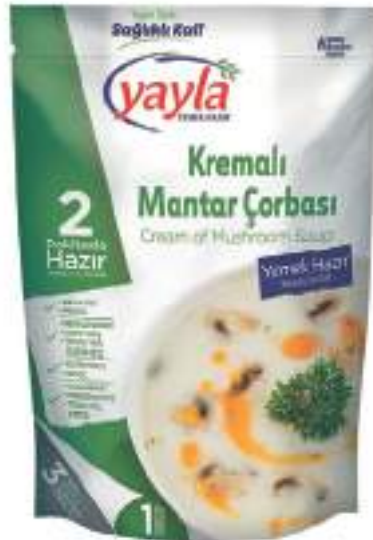
Kremalı Mantar Çorbası Cream of Mushroom Soup