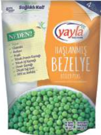
Haşlanmış Bezelye Boiled Peas