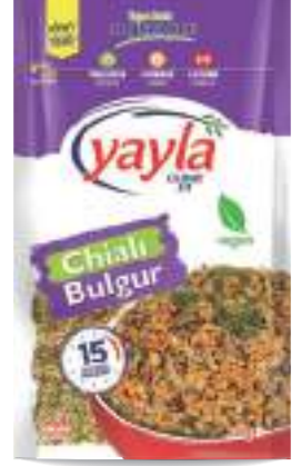
Chialı Bulgur Chia Seed & Bulgur