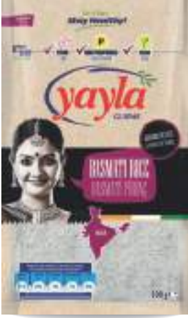
Basmati Pirinç Basmati Rice