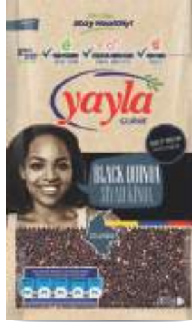
Siyah Kinoa Black Quinoa