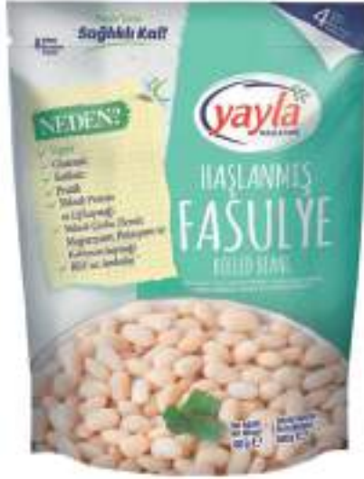
Haşlanmış Fasulye Boiled Beans