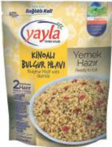
Kinoa Bulgur Pilavi Bulghur Pilaff with Quinoa