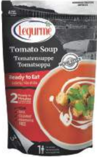
Domates Çorbası Tomato Soup