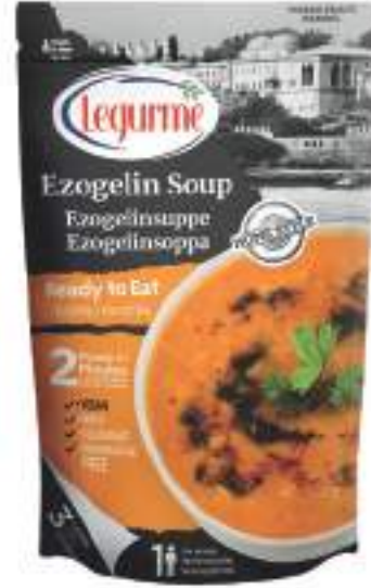
Siyezli Ezogelin Çorbası Ezogelin Soup with Siyez Bulgur