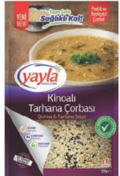
Kinoyalı Tarhana Çorbası Quinoa & Tarhana Soup