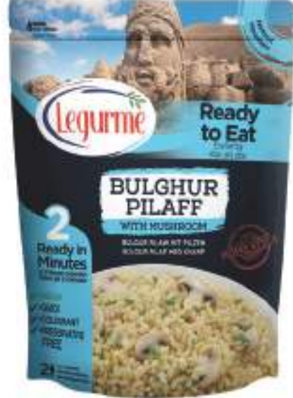
Mantarlı Bulgur Pilavı Bulghur Pilaff with Mushroom