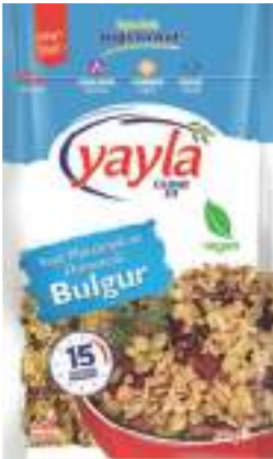
Yeşil Mercimek ve Domatesli Bulgur Green Lentil & Tomato & Bulgur