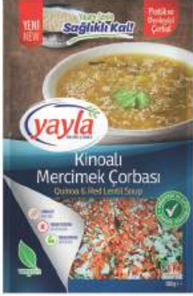
Kinoyalı Mercimek Çorbası Quinoa & Red Lentil Soup