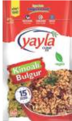
Kinoa Bulgur Quinoa & Bulgur