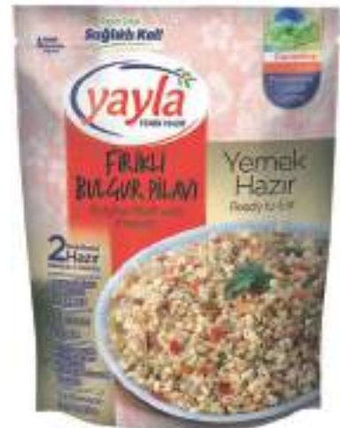
Fırıklı Bulgur Pilavi Bulghur Pilaff with Freekeh