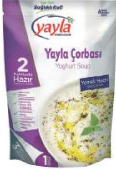
Yayla Çorbası Yoghurt Soup