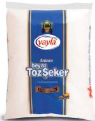
Beyaz Toz Şeker (Granulated White Sugar)