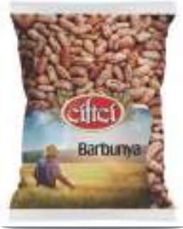
Barbunya Kidney Bean