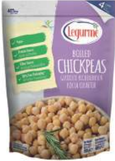
Haşlanmış Nohut Boiled Chickpeas