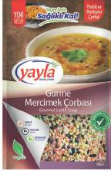
Gurme Mercimek Çorbası Gourmet Lentil Soup