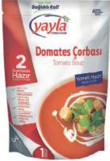
Domates Çorbası Tomato Soup