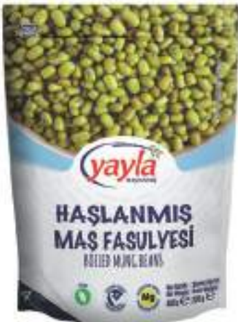
Haşlanmış Maş Fasulyesi Boiled Mung Beans