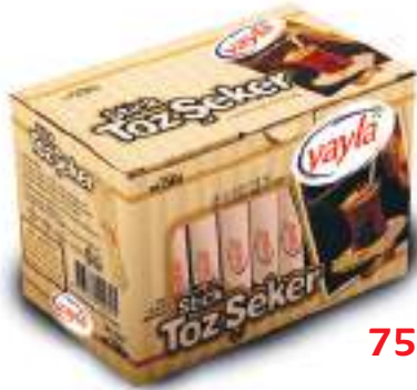
Stick Toz Şeker (Granulated Sugar-Stick)