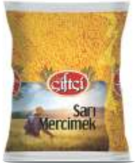
Sarı Mercimek Yellow Lentils