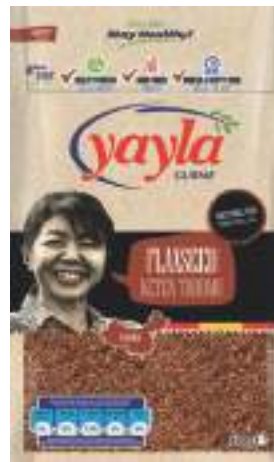
Keten Tohumu Flaxseed