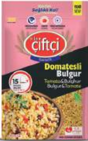
Domatesli Bulgur Tomato & Bulgur