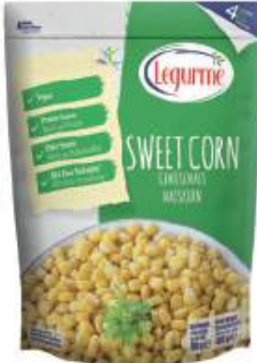
Tane Mısır Sweet Corn