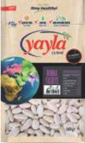
Bomba Fasulye Bomb Beans