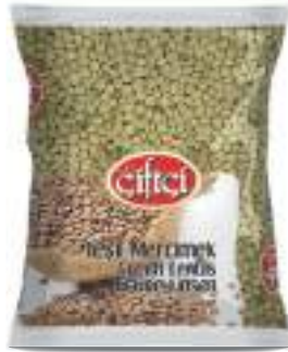
Yeşil Mercimek Green Lentils