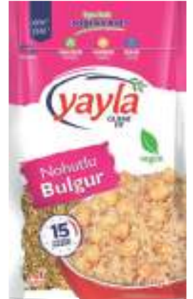
Nohutlu Bulgur Chickpeas & Bulgur