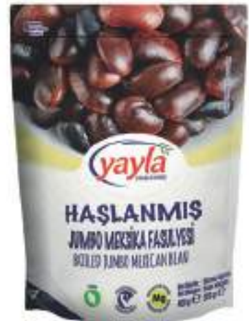
Haşlanmış Jumbo Meksika Fasulyesi Boiled Jumbo Mexican Bean