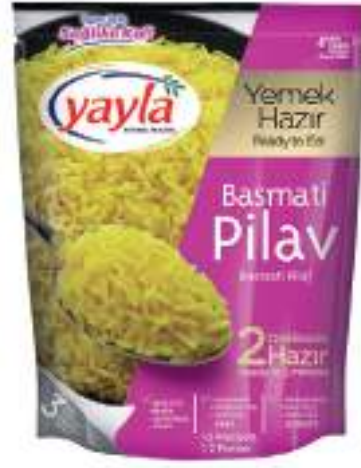
Basmati Pirinç Pilavı Basmati Pilaff