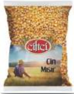
Cin Mısır Corn