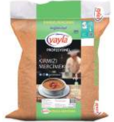
Kırmızı Mercimek Red Lentils