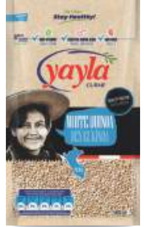
Beyaz Kinoa White Quinoa