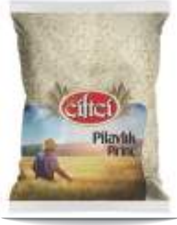
Pilavlık Pirinç Rice