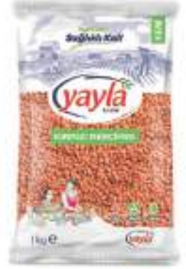
Kırmızı Mercimek Red Lentils