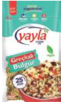
Greçkallı Bulgur Buckwheat & Bulgur