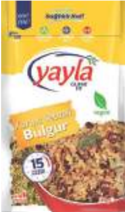
Karışık Sebzeli Bulgur Vegetable Mix & Bulgur