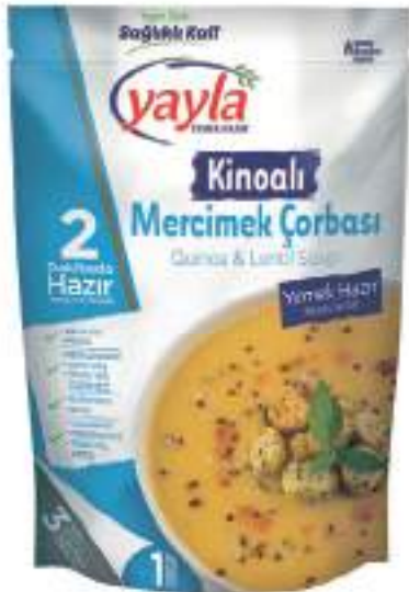
Kinoalı Mercimek Çorbası Quinoa & Lentil Soup