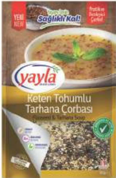
Keten Tohumlu Tarhana Çorbası Flaxseed & Tarhana Soup