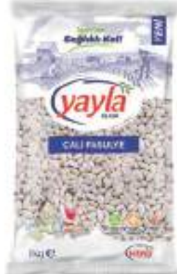
Çalı Fasulye White Kidney