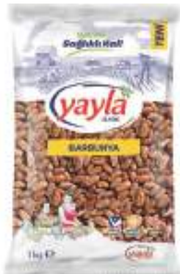
Barbunya Kidney Beans