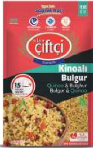
Kinoalı Bulgur Quinoa & Bulgur