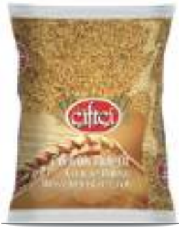
Pilavlık Bulgur Coarse Bulgur