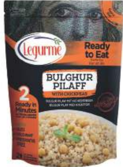
Nohutlu Bulgur Pilavı Bulghur Pilaff with Chickpeas