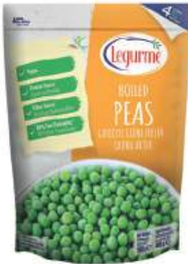
Haşlanmış Bezelye Boiled Peas