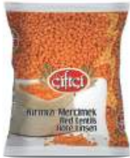
Kırmızı Mercimek Red Lentils