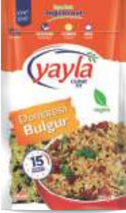
Domatesli Bulgur Tomato & Bulgur