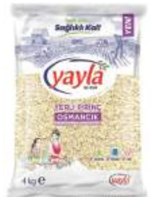
Osmançık Pirinç Osmançık Rice