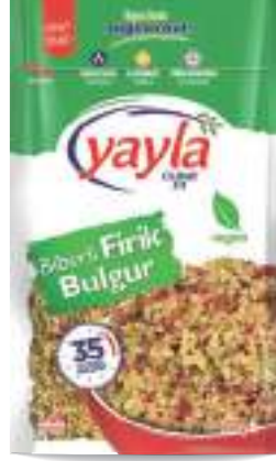
Biberli Firik Bulgur Freekh & Pepper & Bulgur