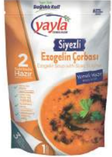
Siyezli Ezogelin Çorbası Ezogelin Soup with Siyez Bulgur