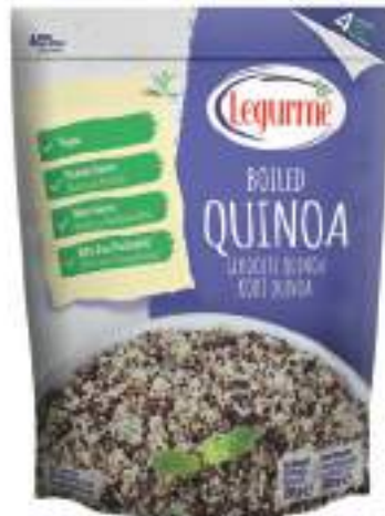
Haşlanmış Kinoa Boiled Quinoa