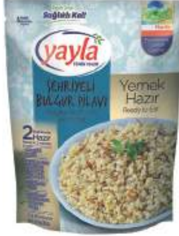
Şehriyeli Bulgur Pilavi Bulghur Pilaff with Vermicelli