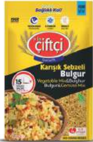
Karışık Sebzeli Bulgur Vegetable Mix & Bulgur