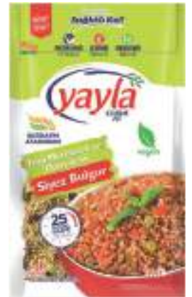
Yeşil Mercimek ve Domatesli Siyez Bulgur Green lentil & Tomato & Siyez Bulgur