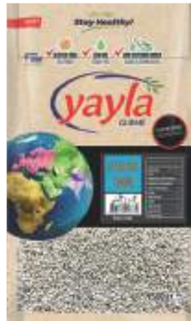
Beyaz Chia Tohumu White Chia Seed