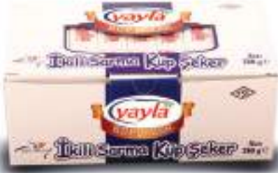
İkili Sarma Küp Şeker (Double Packing Sugar Cube)